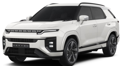
Grand White (WAA)