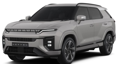
Latte Greige (EBL)*