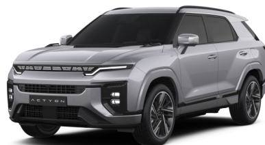
Iron Metal (ADE)*