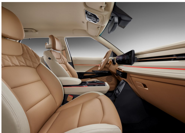
Camel & Beige (EBO)