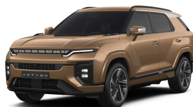
Royal Copper (OBE)*