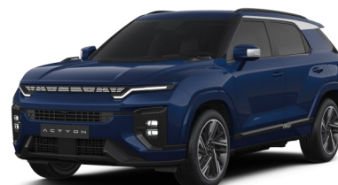
Dandy Blue (BAS)*

* Metallic-Lackierung Peinture métallisée Vernice metallizzata