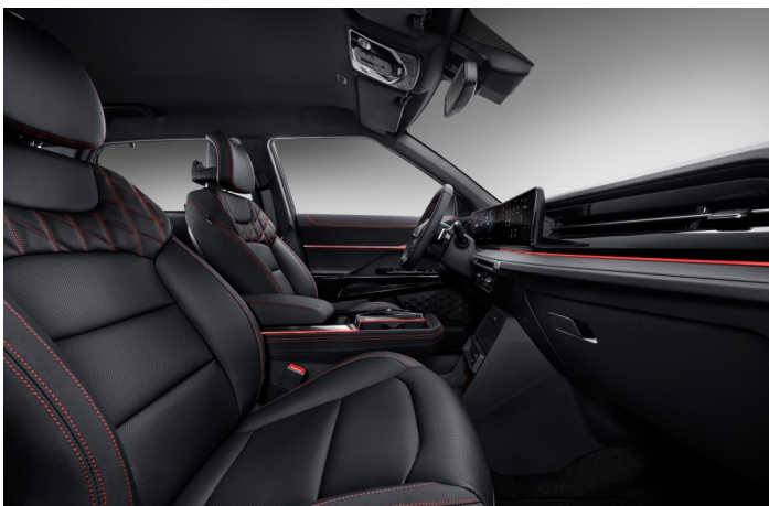
Charcoal Black (LBH)