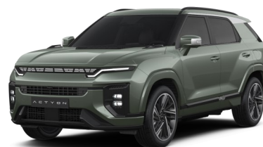
Forest Green (GAO)*